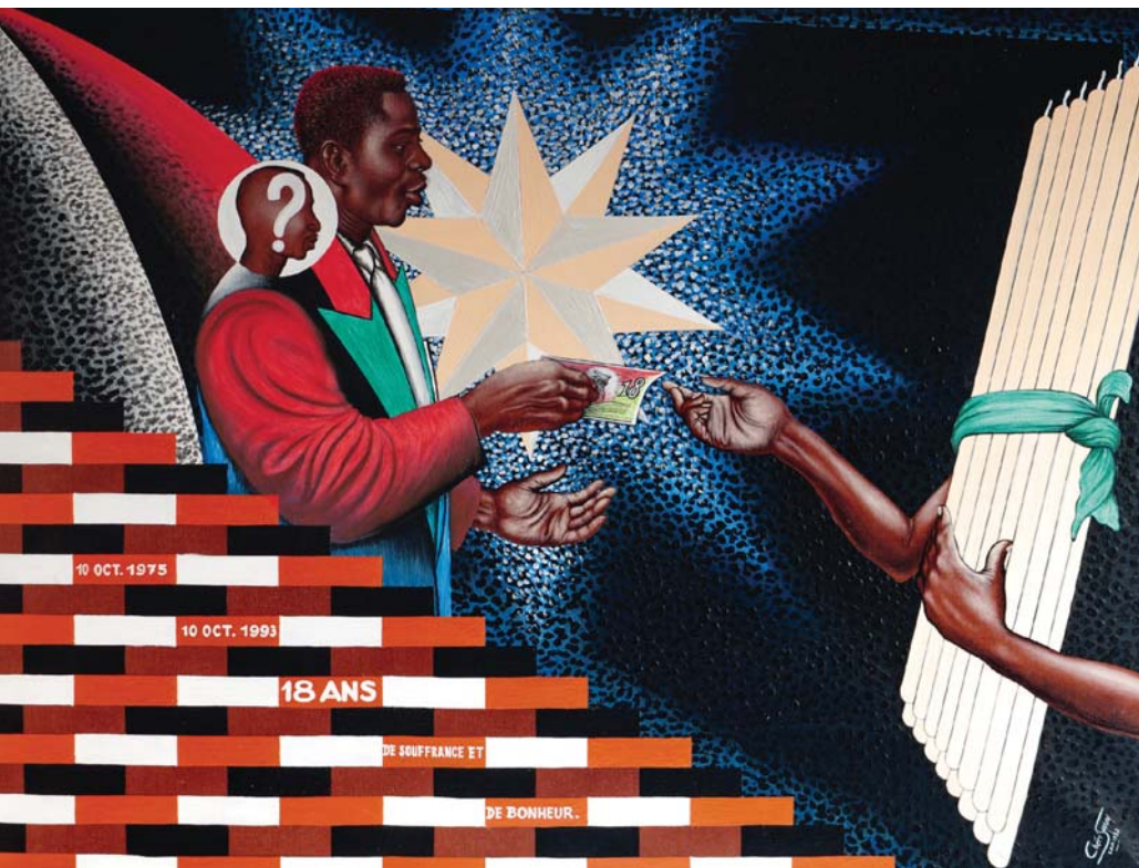
Chéri Samba: 18 ans de souffrance et de bonheur, Acryl auf Leinwand, 89 cm x 117 cm, 1993, Privatsammlung